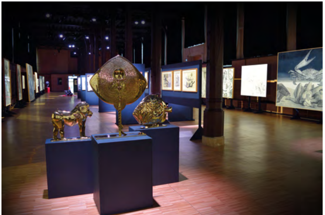
Vue de l'exposition « Rétrospective » au Réfectoire des Cordeliers, à Paris, organisée par l'Université de Paris, en octobre 2019.

À défaut de certitudes, l'œuvre de Trémois, tant par la forme que par le fond, nous offre autant de fulgurantes émotions que de pistes de réflexion. C'est pourquoi elle nous touche ; car même si le mystère originel demeure, elle dévoile au plus profond de nous sensibilité et pensée, deux des plus beaux et singuliers caractères de la nature humaine ! »